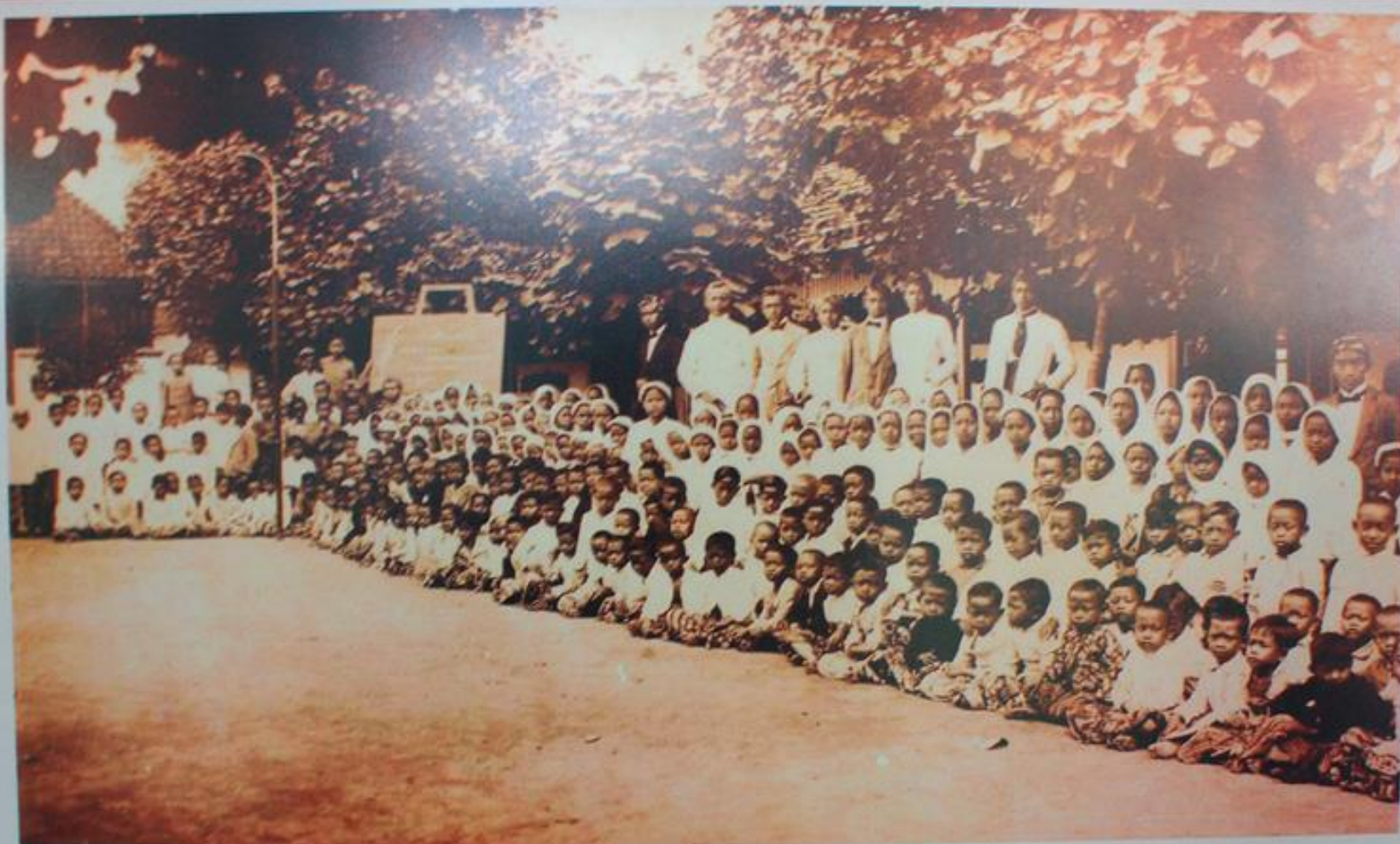
STANDARDSCHOOL MUHAMMADIYAH SURONATAN SEKOLAH PERTAMA YANG DIDIRIKAN KHA.DAHLAN SETELAH DIPINDAH DARI RUMAHNYA TAHUN 1913. (LOKASI : SURONATAN YOGYAKARTA)