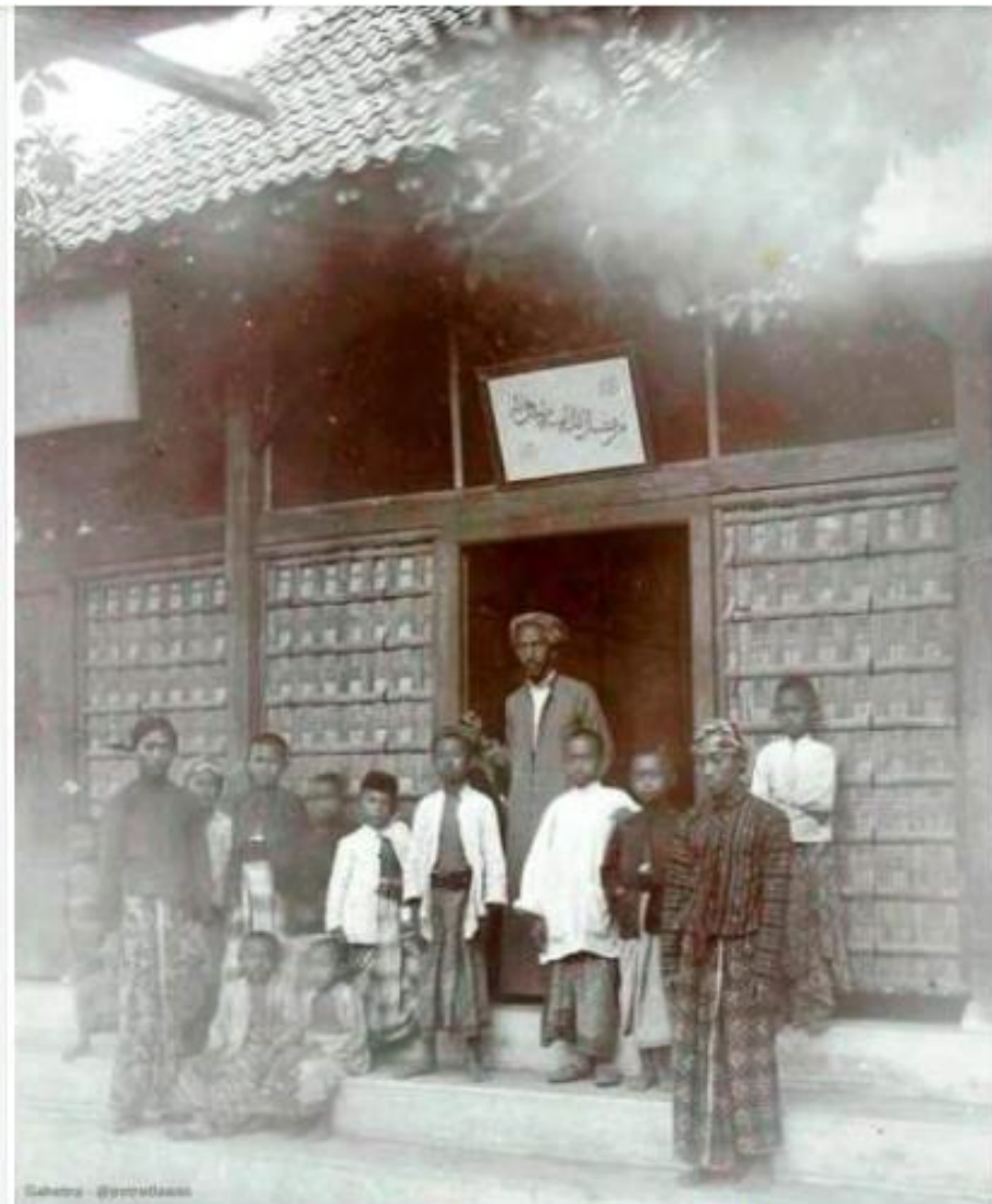
KH Ahmad Dahlan beserta murid-muridnya di Langgar Kidul

KH. Ahmad Dahlan tidak bisa hanya mengandalkan ilmu falak tradisional dalam penentuan arah kiblat. Beliau menggunakan ilmu yang modern saat itu (menggunakan globe dan kompas).